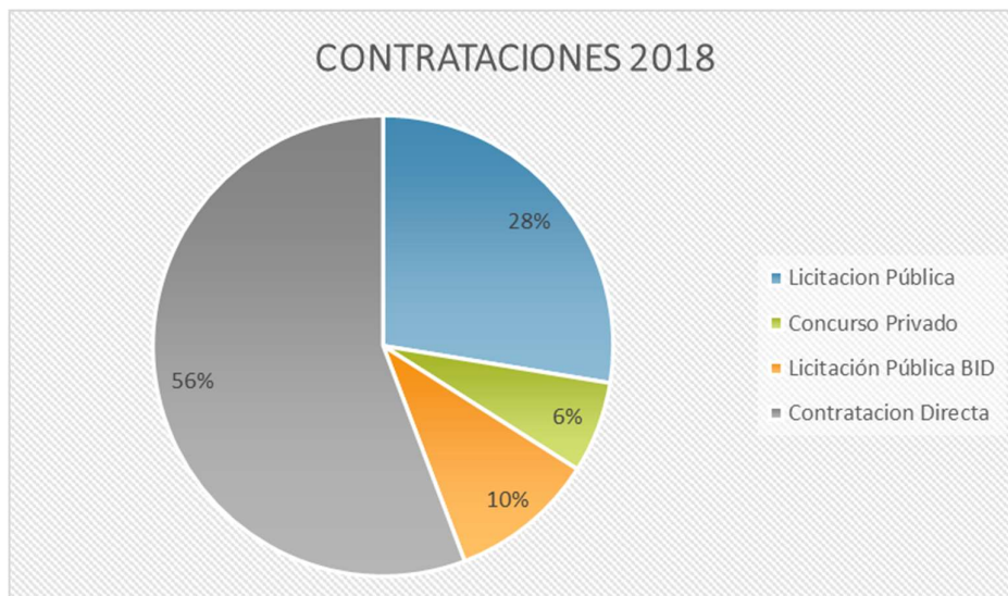
Gráfico N°2: Incidencia proporcional contrataciones.